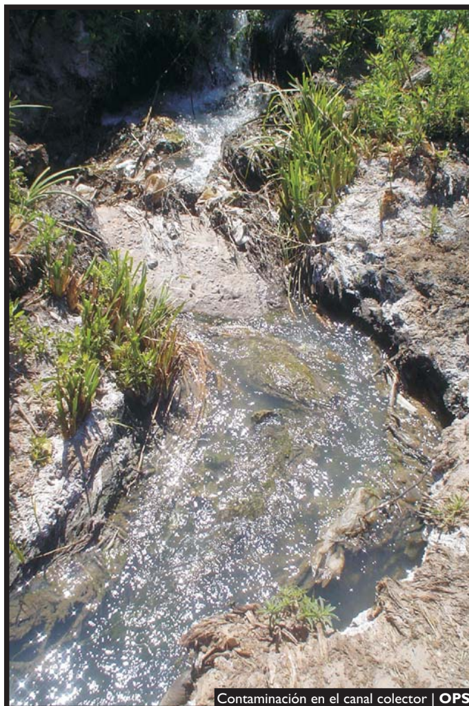
Contaminación en el canal colector | OPS

Nosotros estamos reclamando información constantemente, mi próximo proyecto va a ser solicitar la contratación de una consultora para que haga un monitoreo del aire y del agua, y vamos a seguir trabajando porque esto no se terminó.