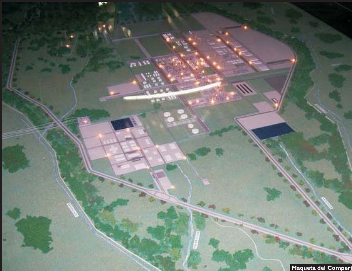
Maqueta del Comperj

E l Complejo Petroquímico de Río de Janeiro ( Comperj ), en el Estado del mismo nombre, es la mayor obra en ejecución por parte del Gobierno Federal de Brasil . Con un desembolso final de U$S 8.400 millones para 2012, su puesta en marcha -junto a otros proyectos en desarrollo- posicionaría al gigante de América del Sur como exportador de productos petroquímicos . Pero la planificación de obras anexas no contempló a los pescadores de Bahía de Guanabara y éstos, a costa de acciones directas y demandas judiciales llegaron a paralizar la construcción de un gasoducto vital para el Comperj.