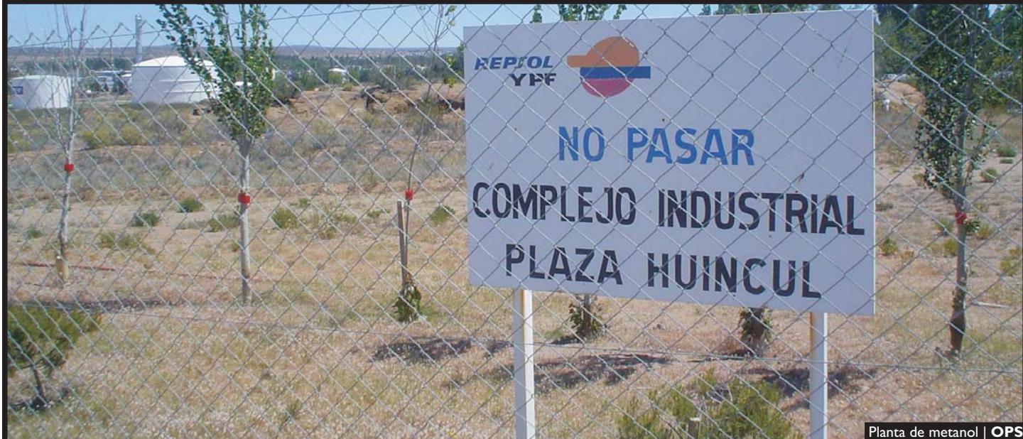
Planta de metanol | OPS

P laza Huincul y Cutral Có constituyen la comarca petrolera neuquina por excelencia; en esas tierras se inició y desde allí creció esta industria que dinamiza la economía provincial. En 1918 se perforó el primero pozo y cuatro años más tarde Nación puso un área bajo control de la recién creada Yacimientos Petrolíferos Fiscales (YPF), donde se erigirían sus campamentos, piedra fundamental de las futuras ciudades. En esa porción de desierto del Territorio Nacional del Neuquén primero nació Cutral-Có, en 1933, y en 1967 -cuando la etapa territorialiana empezaba a ser historia-, llegó Plaza.